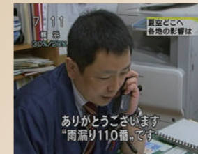
TV 2009年7月29日放送 NHKニュース「おはよう日本」に雨漏りの専門家として出演しました。