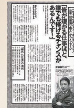
雑誌 週刊プレイボーイ 2014年2月25日号で紹介されました。