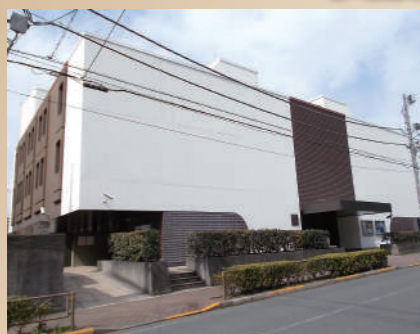
渋谷区 チェコ共和国大使館