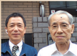
東京都世田谷区 K様

信頼している友人に紹介されて以来、20年以上のお付き合いです。これまでに発注してきた仕事は、常に信頼できる仕事をしていただいていると感じています。