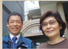
東京都世田谷区 K様

雨漏りのたびにお世話になっていますが、小さなことでもすぐに来てくれるので、いつも本当に助かっています。今回は大規模修繕工事をお願いしました。