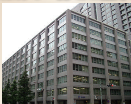
旧イノホール(飯野ビル)