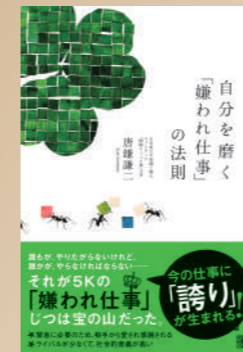
本・嫌われ仕事 2011年に出版されました。