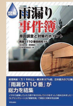
本・雨漏り事件簿 2017年 学芸出版社より出版。