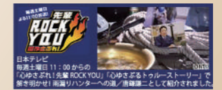
TV 2014年6月14日放送 日本テレビ「心ゆさぶれ!先輩ROCK YOU」で紹介されました。